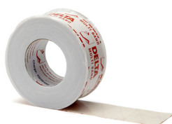
DELTA MULTI-BAND Varenr.: 111 350.