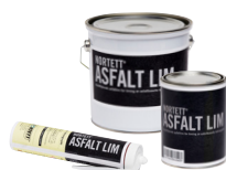
NORTETT® ASFALT LIM 110 629 Tube 0,31 liter 110 632 Boks 1,0 liter 110 655 Spann 2,5 liter