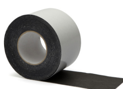
DELTA FLEXX-BAND Varenr.: 111 351.