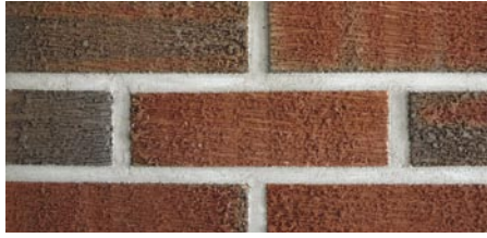
Bratsberg Børstet rød med fargespill