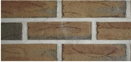
Bratsberg Slottstegl brun med fargespill