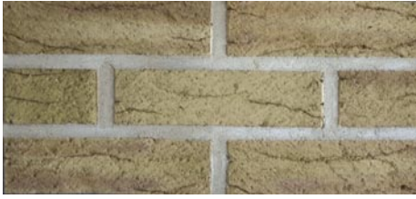
Bratsberg Kloster lys med fargespill