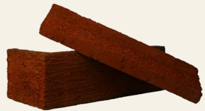
Rettlis og hjørneflis

Tegl er et naturmateriale og det vil alltid forekomme naturlig variasjon i farge og overflatestruktur. Av trykktekniske årsaker vil farger ikke gjengis helt korrekt i brosjyren.