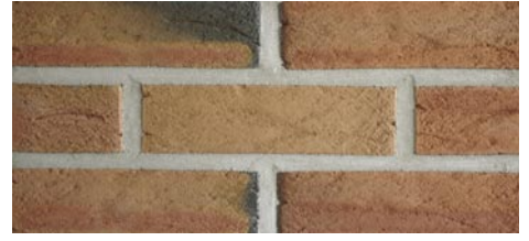
Bratsberg Slottstegl rosa med fargespill