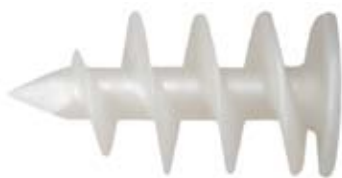
Plugg FID 50