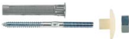
WST 10 x 140 FIP - håndvaskinnfesting for montering med forankringsmørtel (F.eks i Leca eller hulltegl)