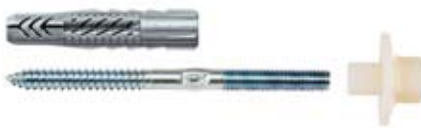
WD - Innfestingssett for håndvask og urinal