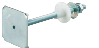
WDP - innfestingssett for håndvask og urinal