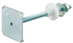
WDP - Innfestingssett for håndvask og urinal