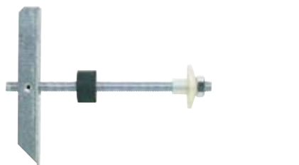
Vippeanker Sanitær KM 10 x 240 håndvask og urinal