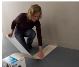
3. & 4.