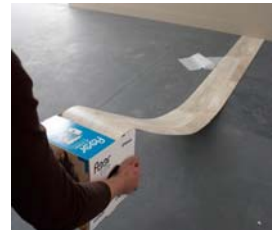
5. & 6.