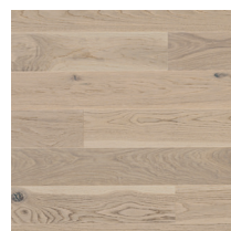
Shade Oak Antique White Plank XT