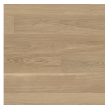
Shade Oak Essence Plank XT