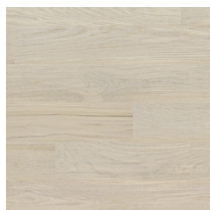
Shade Oak Cotton White Plank XT