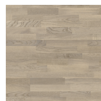
Shade Oak Misty Grey TreS