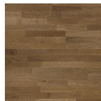
Shade Oak Praline TreS