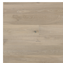
Shade Oak Satin White Plank