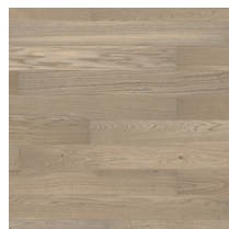
Shade Oak Cream White MiniPlank