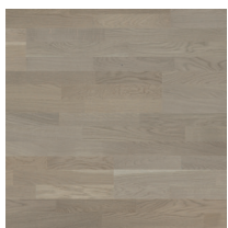
Shade Oak Evening Grey TreS