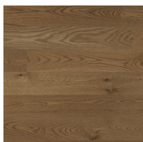
Shade Oak Antique Praline Plank