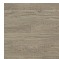
Shade Oak Evening Grey MidiPlank