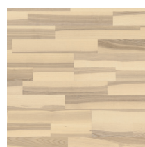
Shade Ash Melange DuoPlank