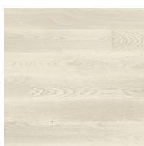
Shade Ash Pearl White Plank