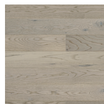
Shade Oak Misty Grey Plank