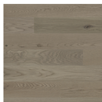
Shade Oak Soft Grey Plank