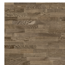
Shade Ash Ginger TreS