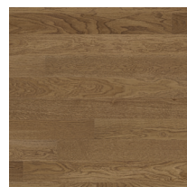
Shade Oak Praline MiniPlank