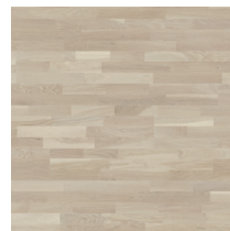
Shade Oak Satin Soft White TreS