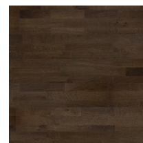
Shade Oak Cumin TreS

Bildene viser bare fargen på gulvet. For flere detaljer om gradering og variasjoner se Grading Bok eller www.tarkett.no . Tarketts internasjonale utvalg av gulv består av mange forskjellige produkter. Noen av disse er ikke for salg i Norge. Selv om alle bildene som er tatt for å gjengi det ferdige produktet er gjort på best mulig måte, kan kvaliteten på skjerm og skriver samt naturlig variasjonen i trevirket resulterer i variasjoner i farge og struktur av de enkelte parkettbord.