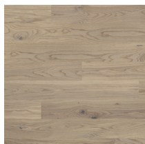
Shade Oak Cream White MidiPlank