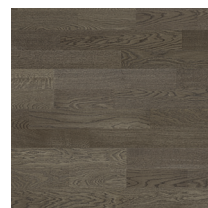
Shade Oak Stone Grey DuoPlank