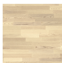
Shade Ash Linen White TreS