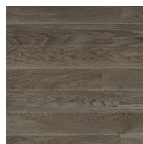
Shade Oak Stone Grey Plank