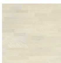
Shade Ash Pearl White TreS