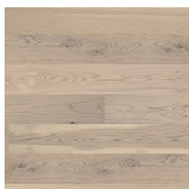
Shade Oak Antique White Plank