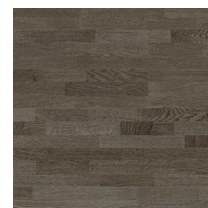
Shade Oak Stone Grey TreS