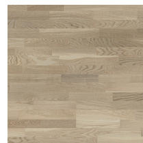
Shade Oak Cream White TreS