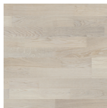
Shade Oak Cotton White DuoPlank