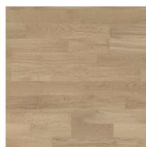
Shade Oak Essence DuoPlank