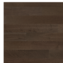
Shade Oak Cumin MidiPlank