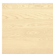
Shade Ash Linen White Plank