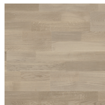
Shade Oak Cream White DuoPlank