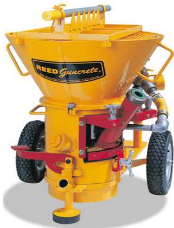
REED Sova tørresprøyte med støvfilter

REED Sove-sprøyten, eller det sprøyteutstyret som blir valgt, må være utstyrt med støvoppsamlings system som vist under eller tilsvarende.