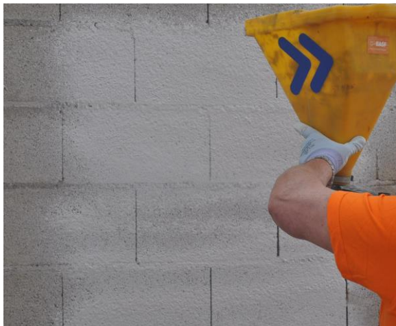
Billede 2: Sprøjtepåføring af MasterSeal 560

Hurtighærdende, 2-komponent, elastisk letvægtsmembran til vandtætning og beskyttelse af beton. Fås i LYS GRÅ og HVID