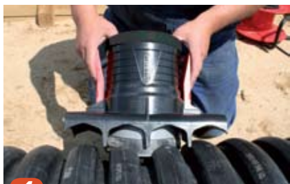
4 Sadelgrenrøret plasseres i det rengjorte hullet. Kontroller at sadelgrenrørets profil følger rørprofilen.