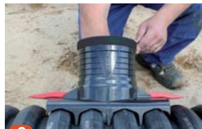
6 Sjekk med hånden at pakningen ligger inntil innvendig X-Stream rør.