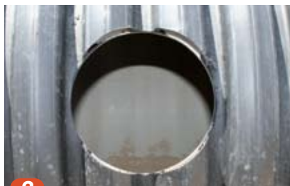
2 Det er viktig å rense hullet for eventuelle skjærespon.