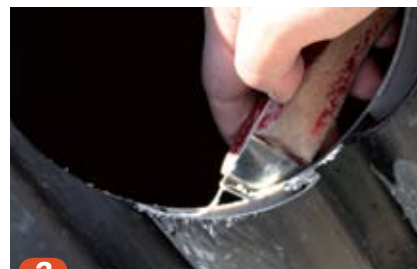
3 Skjærespon fjernes ved hjelp av skrapeverktøy eller stålsvamp.