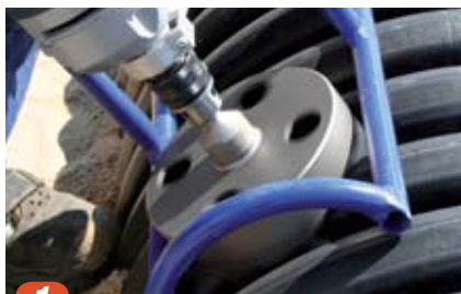
1 For å oppnå korrekt montering og tetthet skal Wavins borerigg og hullsag benyttes. Senterbor skal plasseres i bunnen mellom to korrugeringer.

OBS! Kontroller at sadelgrenrøret er merket med den aktuelle X-Stream dimensjonen for montering.