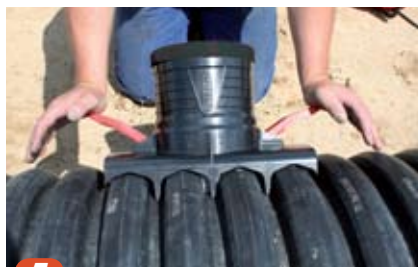
5 Press håndtakene ned parallelt til de låser.