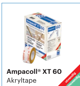
Ampacoll® XT 60 Akryltape