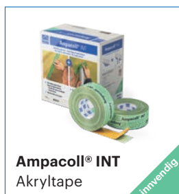
Ampacoll® INT Akryltape