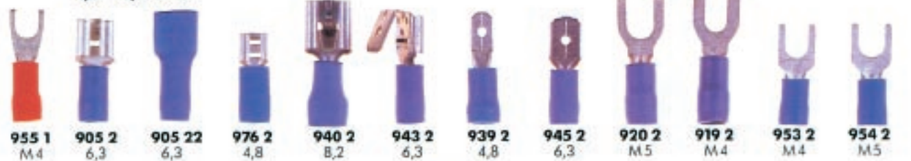
955 1 M4 905 2 6,3 905 22 6,3 976 2 4,8 940 2 8,2 943 2 6,3 939 2 4,8 945 2 6,3 920 2 M5 919 2 M4 953 2 M4 954 2 M5