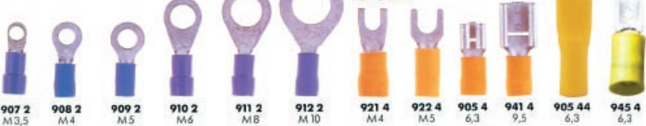
907 2 M3,5 908 2 M4 909 2 M5 910 2 M6 911 2 M8 912 2 M10 921 4 M4 922 4 M5 905 4 6,3 941 4 9,5 905 44 6,3 945 4 6,3