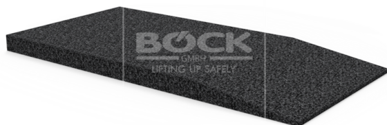
W110 700 002 | Ramp 50mm