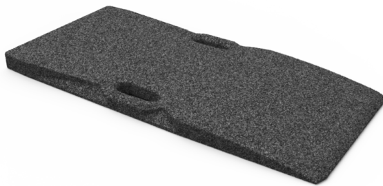
W110 700 002 | Ramp 50mm