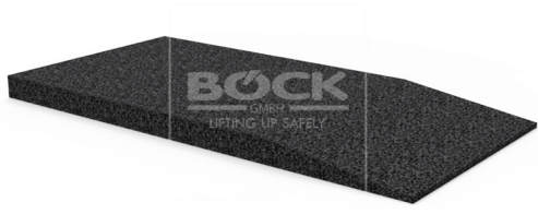
W110 700 002 | Ramp 50mm