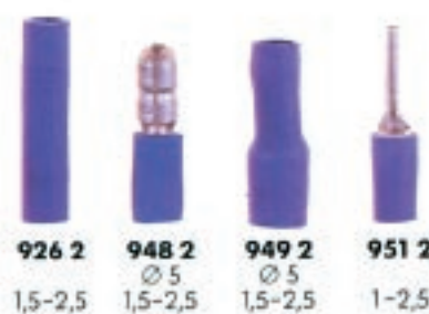
926 2 1,5-2,5 948 2 Ø 5 1,5-2,5 949 2 Ø 5 1,5-2,5 951 2 1-2,5