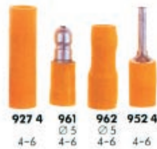
927 4 4-6 961 Ø 5 4-6 962 Ø 5 4-6 952 4 4-6