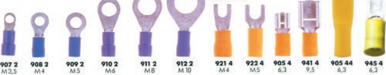
907 2 M3,5 908 2 M4 909 2 M5 910 2 M6 911 2 M8 912 2 M10 921 4 M4 922 4 M5 905 4 6,3 941 4 9,5 905 44 6,3 945 4 6,3