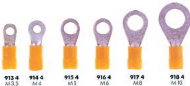
913 4 M3,5 914 4 M4 915 4 M5 916 4 M6 917 4 M8 918 4 M10