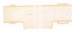
991 4 6,3 mm