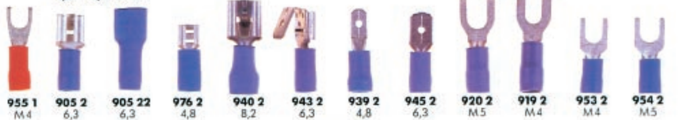
955 1 M4 905 2 6,3 905 22 6,3 976 2 4,8 940 2 8,2 943 2 6,3 939 2 4,8 945 2 6,3 920 2 M5 919 2 M4 953 2 M4 954 2 M5