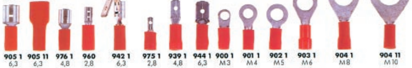
905 1 6,3 905 11 6,3 976 1 4,8 960 2,8 942 1 6,3 975 1 2,8 939 1 4,8 944 1 6,3 900 1 M3 901 1 M4 902 1 M5 903 1 M6 904 1 M8 904 11 M10