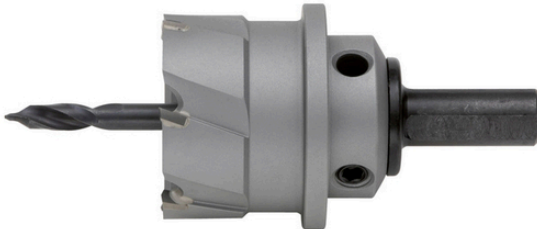
Utbyttbar tange fra Ø32mm