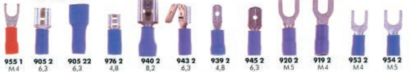
955 1 M4 905 2 6,3 905 22 6,3 976 2 4,8 940 2 8,2 943 2 6,3 939 2 4,8 945 2 6,3 920 2 M5 919 2 M4 953 2 M4 954 2 M5