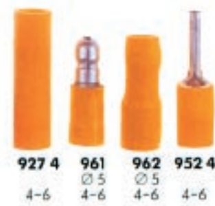
927 4 4-6 961 Ø 5 4-6 962 Ø 5 4-6 952 4 4-6