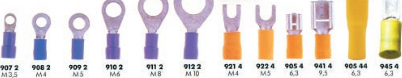
907 2 M3,5 908 2 M4 909 2 M5 910 2 M6 911 2 M8 912 2 M10 921 4 M4 922 4 M5 905 4 6,3 941 4 9,5 905 44 6,3 945 4 6,3