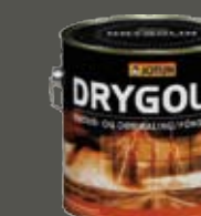
Drygolin Vindus- og Dørmaling