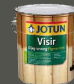
Visir Oljegrunning Pigmentert

For dører og vinduer anbefales Drygolin Vindus- og Dørmaling. Følg produktenes bruksanvisning.