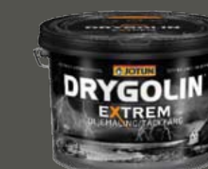
Drygolin Extrem Oljemaling