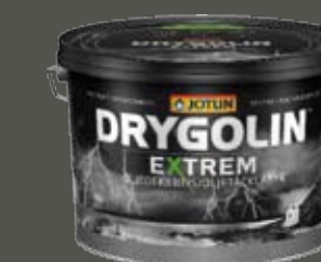
Drygolin Extrem Oljedekkkbeis