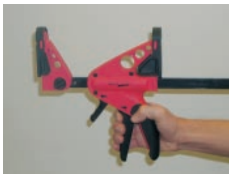
Press fra hverandre