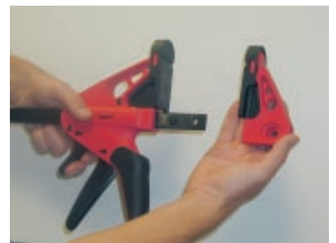
Avmonter fast endeanslag ...