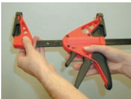
... og monter anslaget i motsatt ende