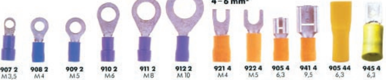
907 2 M3,5 908 2 M4 909 2 M5 910 2 M6 911 2 M8 912 2 M10 921 4 M4 922 4 M5 905 4 6,3 941 4 9,5 905 44 6,3 945 4 6,3