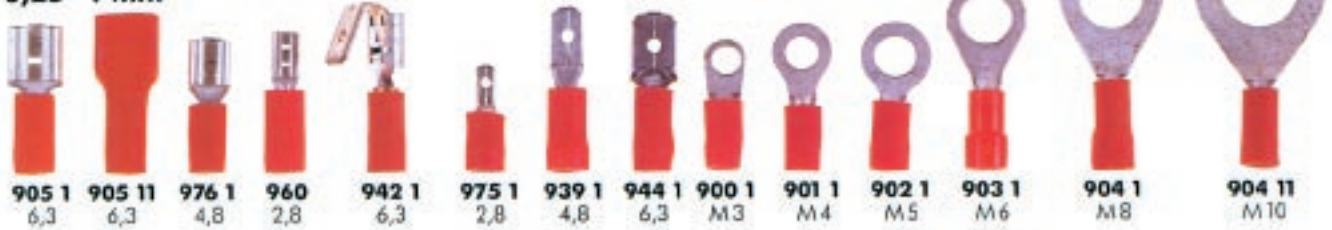
905 1 6,3 905 11 6,3 976 1 4,8 960 2,8 942 1 6,3 975 1 2,8 939 1 4,8 944 1 6,3 900 1 M3 901 1 M4 902 1 M5 903 1 M6 904 1 M8 904 11 M10