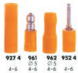
927 4 4-6 961 Ø 5 4-6 962 Ø 5 4-6 952 4 4-6