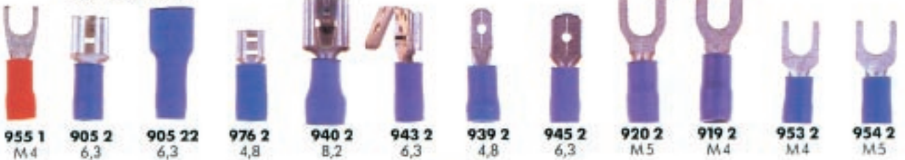
955 1 M4 905 2 6,3 905 22 6,3 976 2 4,8 940 2 8,2 943 2 6,3 939 2 4,8 945 2 6,3 920 2 M5 919 2 M4 953 2 M4 954 2 M5