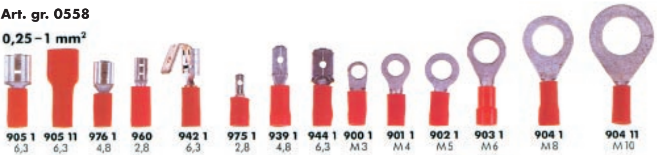
905 1 6,3 905 11 6,3 976 1 4,8 960 2,8 942 1 6,3 975 1 2,8 939 1 4,8 944 1 6,3 900 1 M3 901 1 M4 902 1 M5 903 1 M6 904 1 M8 904 11 M10