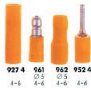
927 4 4-6 961 Ø 5 4-6 962 Ø 5 4-6 952 4 4-6