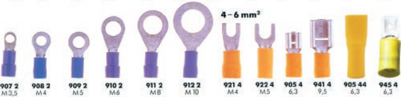
907 2 M3,5 908 2 M4 909 2 M5 910 2 M6 911 2 M8 912 2 M10 921 4 M4 922 4 M5 905 4 6,3 941 4 9,5 905 44 6,3 945 4 6,3