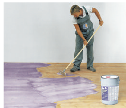
PCI Gisogrund 404 i fiolett kontrollfarge har høy vedheftstyrke og sørger for at avretningsmasse og andre produkter får god heft til underlaget.