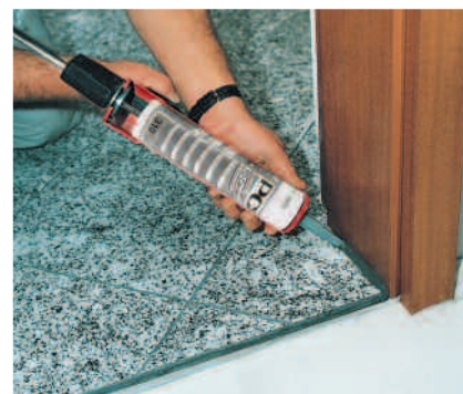
PCI Carraferm er spesielt egnet til tetting av forbindelses- og dilatasjonsfuger som er følsomme overfor misfarging.