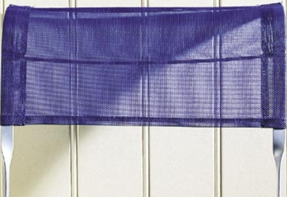
Huntonit MDF umalt veggplate, type: Royal