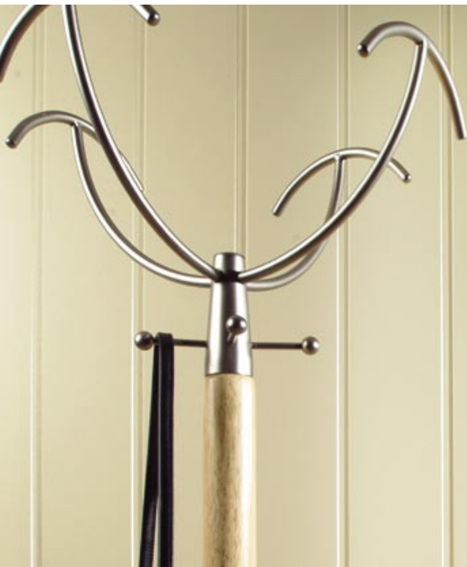
Huntonit MDF umalt veggplate, type: Elegance