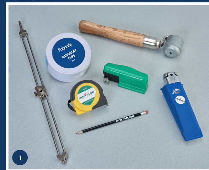
Bilde 1 NØDVENDIG VERKTØY