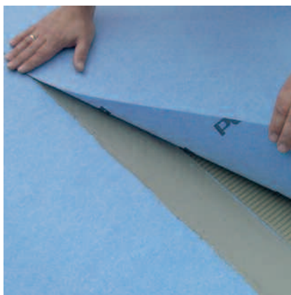
Legg på neste lengde innenfor åpentiden.