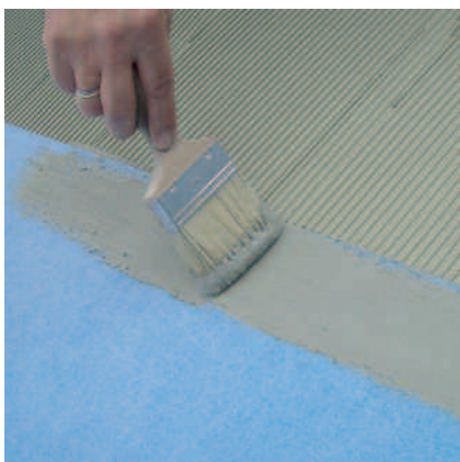
Skjøtene tettes med PCI Seccoral 1K/2K påført heldekkende på PCI Pecilastic-W-lengden.

mineralske underlag skal først primes med PCI Gisogrund fortynt med vann i forholdet 1:1. Tørre, fastgjorte sponplater primes med PCI Wadian. Primerene må være herdnet før PCI Pecilastic W limes på.