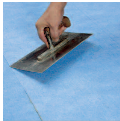
Lengdene presses fast med glattebrett, gummivalse eller Brett.