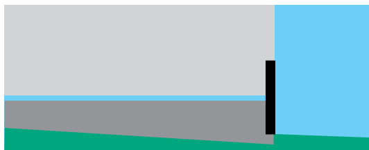
Figur over: Ved understøp av fundamenter vil betongen normalt sette seg, og understøttelsen blir ufullstendig.