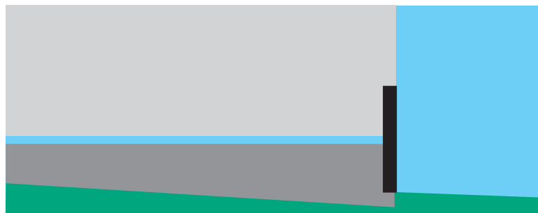
Figur over: Ved understøp av fundamenter vil betongen normalt sette seg, og understøttelsen blir ufullstendig

For helse-, miljø- og sikkerhetsinformasjon - se eget HMS-datablad. HMS-databladene finnes på www.resconmapei.com .