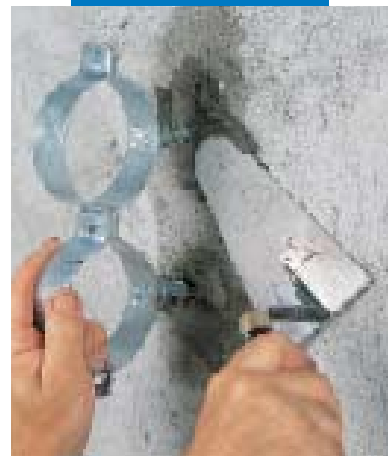
Fixing brackets for pipes using Lampocem