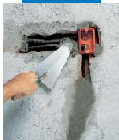
Fixing enclosures and electric cable tubes using Lampocem