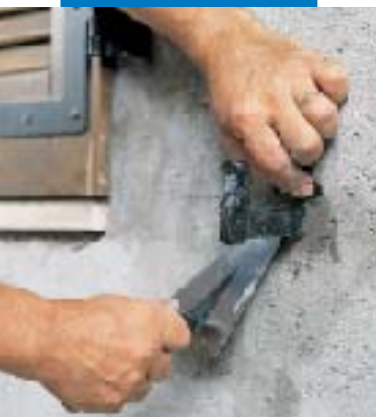
Fixing foundation bolts for windows using Lampocem