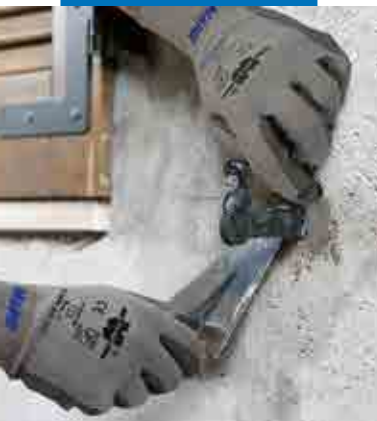
Fiksering av fester for vindusskodder

Dette er meget viktig å utføre nøyaktig, spesielt dersom underlaget er sterkt absorberende (mur, murverk) eller dersom det er utsatt for sterk sol.