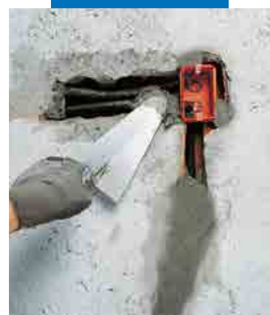
Festing av kabelrør og kapsler med Lampocem