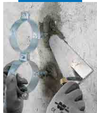
Festing av rørbraketter med Lampocem