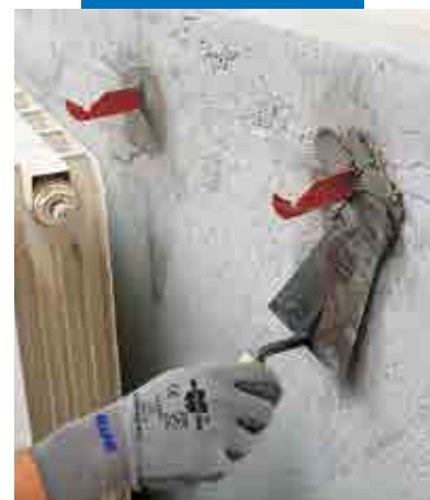
Festing av forankringsbolter til radiatorer med Lampocem