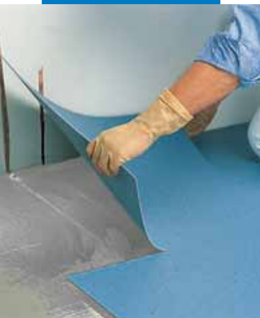
Legging av PVC fliser med Ultrabond Eco V4 Conductive