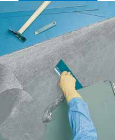
Påføring av Ultrabond Eco V4 Conductive

De tekniske anbefalinger og detaljer som fremkommer i denne produktbeskrivelse representerer vår nåværende kunnskap og erfaring om produktet. All ovenstående informasjon på likevel bli betraktet som retningsgivende og gjenstand for vurdering. Enhver som benytter produktet må på forhånd forsikre seg om at produktet er egnet for tilsiktet anvendelse. Brukeren står selv ansvarlig dersom produktet blir benyttet til andre formål enn anbefalt, eller ved feilaktig utførelse.