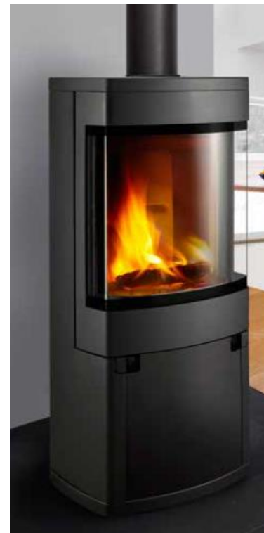
Fig. 1 Radius 300 (fra Hearth and Home).

Radius 100 og Radius 300 tilfredsstillers kravene til sikkerhet mot brann i henhold til NS-EN 13240, forutsatt montasje som angitt i pkt. 6.