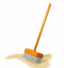
Etterfyll alle fugene.