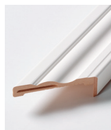
HVIT PROFILERT GERIKT 92 mm