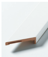
HVIT GLATT GERIKT 92 mm