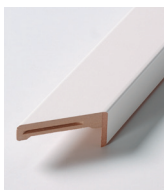
HVIT GLATT GERIKT 65 mm

For at vi bedre skal kunne dekke markedets behov har vi tatt frem gerikter som er 92 mm brede. Disse kan brukes ved bytte av dør/karm uten at man behøver tapetesere eller male om. Utover dette har vi tatt frem en mer tradisjonell profilert gerikt som er 65 mm bred.