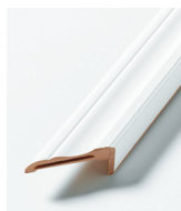
HVIT PROFILERT GERIKT 65 mm